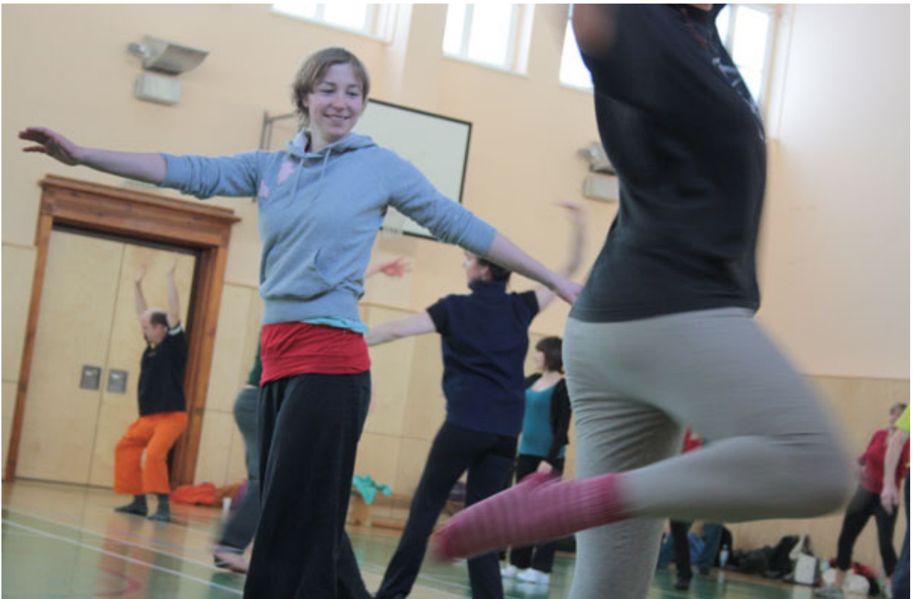
TURN! Workshop, Foto: Sylvia Kadur

2000 Menschen, ein Tag, eine Choreografie – TURN! bringt Leipzig in Bewegung.