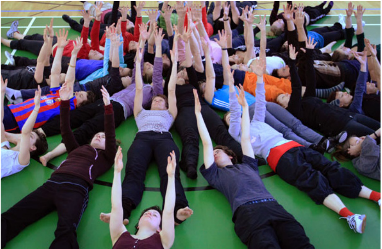
TURN! Workshop

Beim ersten Workshop am 24. Februar in der GutsMuths-Halle haben 45 Menschen gezeigt, wie die Choreografie mit einer größeren Gruppe aussehen kann. Sie haben mit Begeisterung und Freude mitgemacht und ihre eigenen Bewegungen durch Improvisation eingebracht.