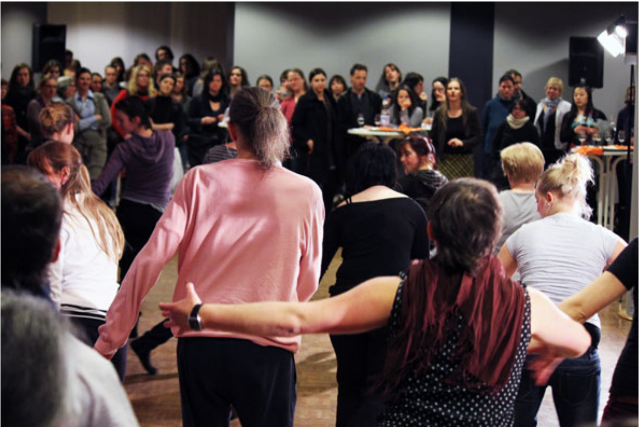
Präsentation von TURN! im Zeitgeschichtlichen Forum Leipzig